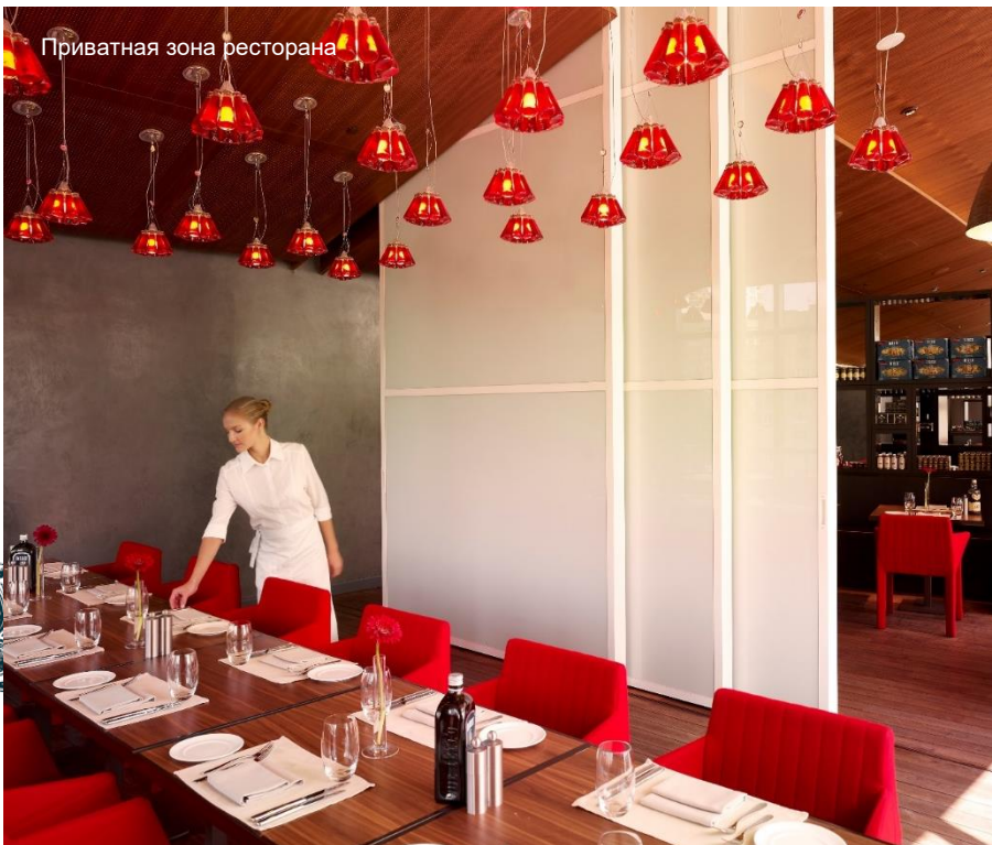
Приватная зона ресторана